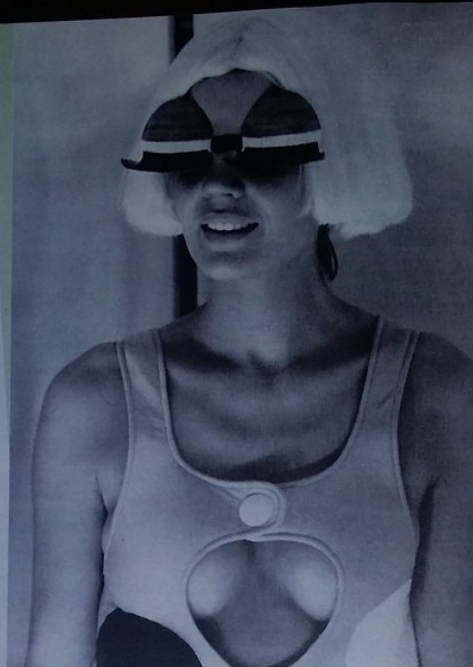
Guarda lontano Quando applichi la crema sul viso, massaggiarla anche sul collo, partendo dalle clavicole e risalendo fino al sottomento e dietro le orecchie: se lo fai tutti i giorni, previeni le rughe orizzontali (collana di Venere) e il cedimento dei tessuti. Nella foto, una modella alle sfilate anni '70 di André Courrèges.

Décolleté: applica una crema rassodante. Con pollice e indice, pizzicotta la zona dalla parte alta del seno alla base del collo. Infine premi i palmi leggermente, portandoli verso il mento. Ripeti 20 volte.